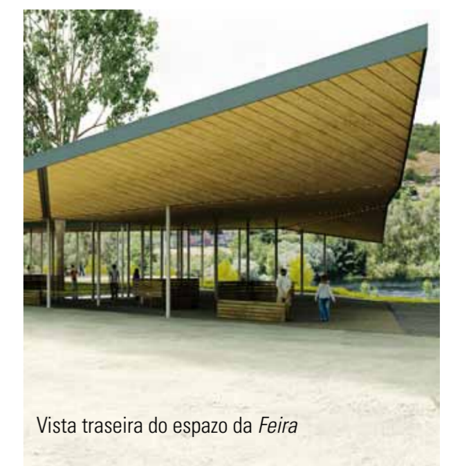
Vista traseira do espazo da Feira

Materiais naturais, madeiras e granitos en perfecto diálogo para reconstruír un espazo que xa é patrimonio de todos os ourensáns e que convidamos ao turista a coñecer. Para comer un bo polbo, os días 7 e 17, disfrutando da beleza do Miño.