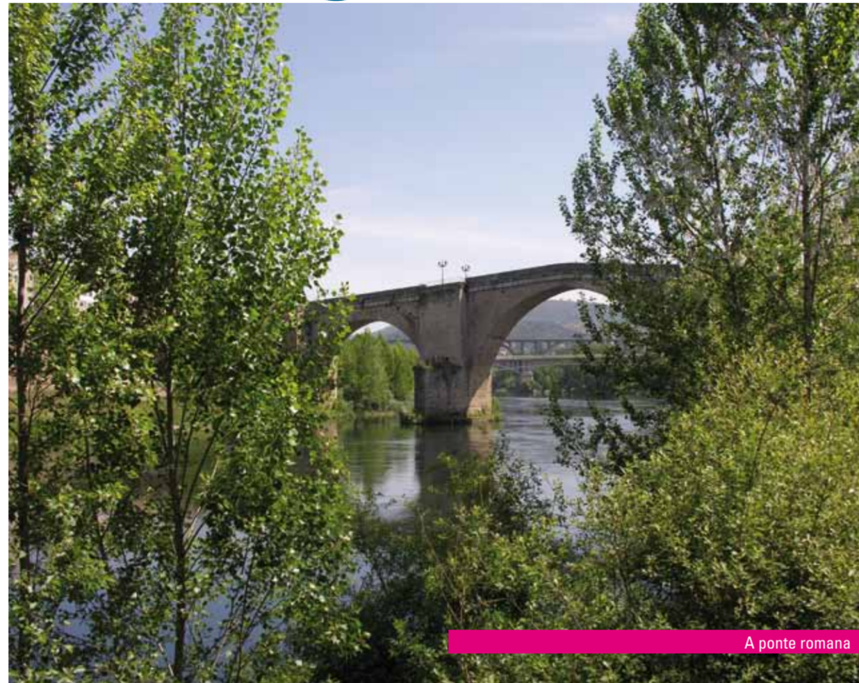
A ponte romana

Os concellos que apoiaran a súa candidatura na reunión celebrada na vila andaluza de Lanjarón souberan recoñecer o futuro dunha cidade no cruzamento dos ríos Miño e Barbaña onde a arte románica, natureza, gastronomía e moda mestúranse coa auga termal para criar un lugar único onde relaxarse e desfrutar. Alén diso, esta honra chega por dereito propio; Ourense co seu imenso océano subterráneo que aflora á superficie en decenas de mananciais, é un dos maiores produtores de auga termal de Europa, só por tras de Budapest. Para facerse unha idea, basta un dato: un balneario común abastécese cunha surxencia de dous ou tres litros por minuto; en Ourense, as nosas Burgas botan polos seus canos cada minuto até 300 litros de auga que pode chegar aos 60°C. Non é mal comezo.