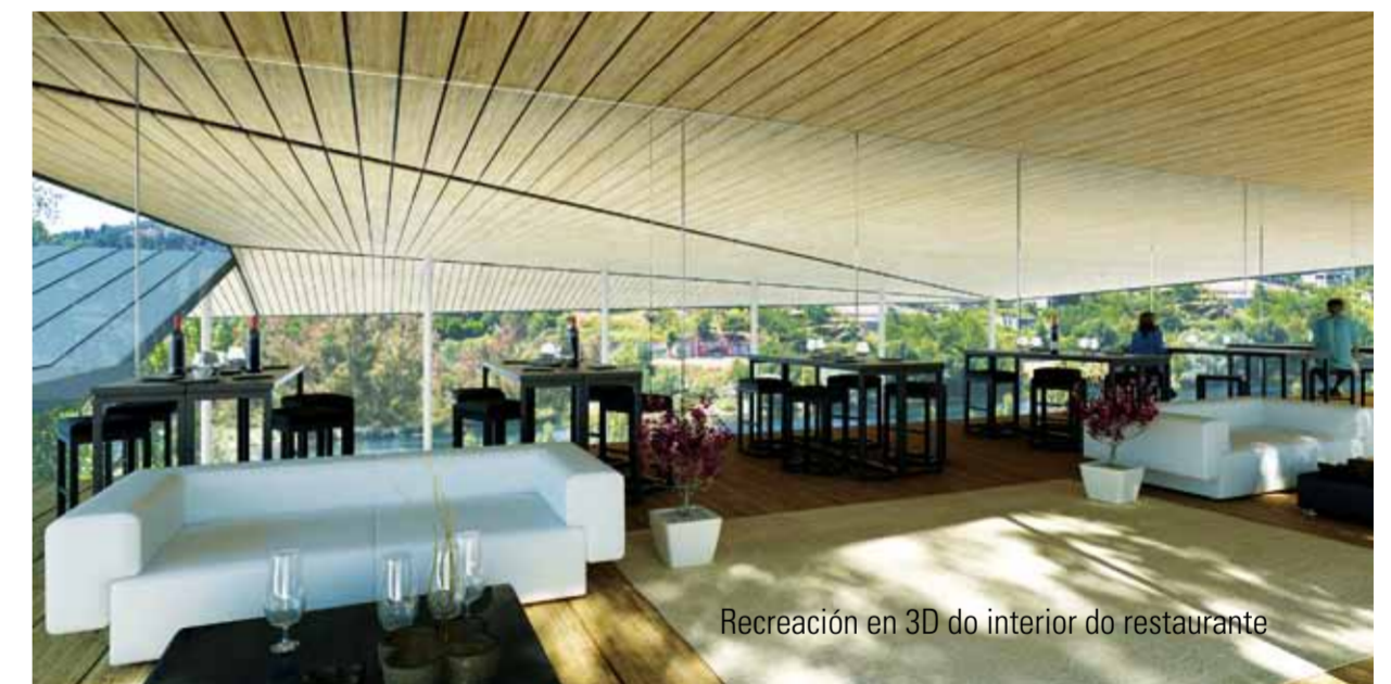
Recreación en 3D do interior do restaurante

Desde tempos remotos, a cidade de Ourense vítese de feira os días 7 e 17 de cada mes. Veciños e visitantes levan anos acudindo a unha cita na que todo é ritual; degustar o tradicional polbo e a carne ao caldeiro ou aproveitar para facer compras de sementes, plantas, roupa, artigos de ferretería ou o que cada un queira atopar. Foron moitos os lugares onde a tradicional feira de Ourense estivo instalada ao longo da historia. Sempre viva, herdeira directa daqueles antigos mercados de compra e venda de gando e ponto de reunión das xentes da cidade, algún aínda lembran cando se celebraba, non sen barafunda, no actual pabellón deportivo dos Remedios. Desde fai 30 anos a feira ocupa un espazo privilexiado nas beiras do Miño, ao carón dos mananciais termais, mas permanecía isolada por imponentes muros; unhas moles que foron derribadas para deixar paso a un espazo diáfano que se integre no seu entorno. A pasada primavera, a Concellería e Industria de Ourense puxo a andar un ambicioso proxecto arquitectónico que transforma radicalmente este espazo e abre ao río, convertíndoo nun elemento máis da oferta turística e termal das beiras do Miño no seu paso por Ourense. Os arquitectos Carmen Mazaira e Tomás Valente idearon para este espazo unha gran cuberta polidráulica que abraza o espazo onde, entre carballos e eucaliptos, fan o seu negocio as polbeiras e taberneiros. A idea, din, é xeran unha unidade, crear un Campo da Feira para todos.