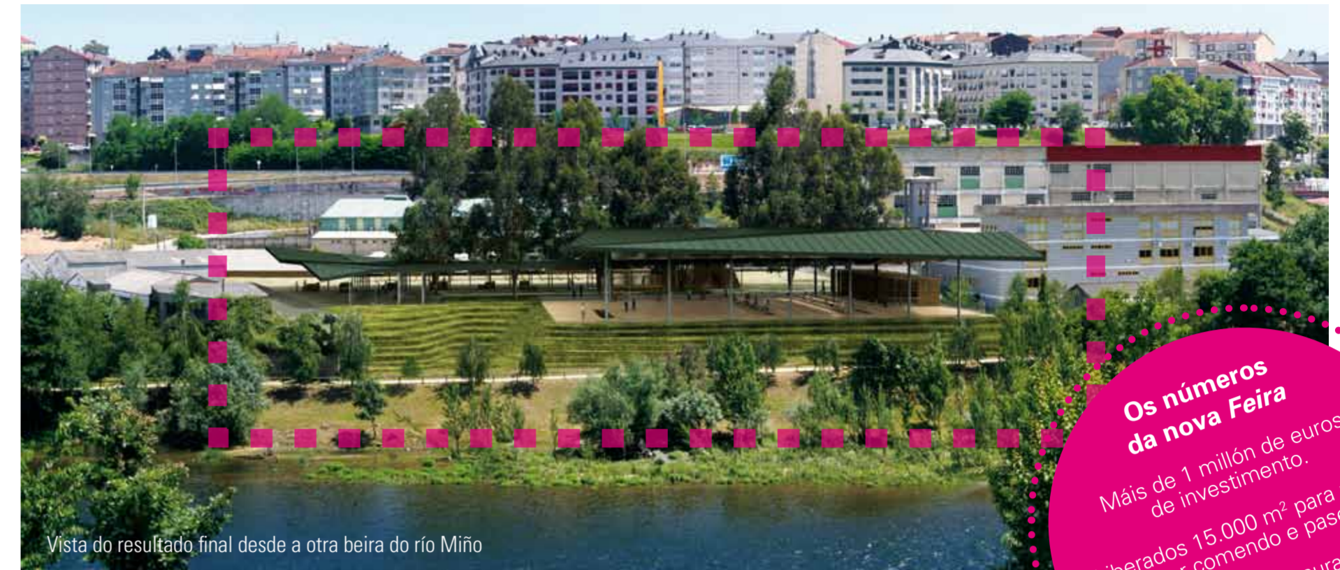
Vista do resultado final desde a outra beira do río Miño

Os números da nova Feira Máis de 1 millón de euros de investimento. Liberados 15.000 m 2 para poder disfrutar comendo e paseando. Creación dun restaurante e servizo de bar permanente con 90 prazas.