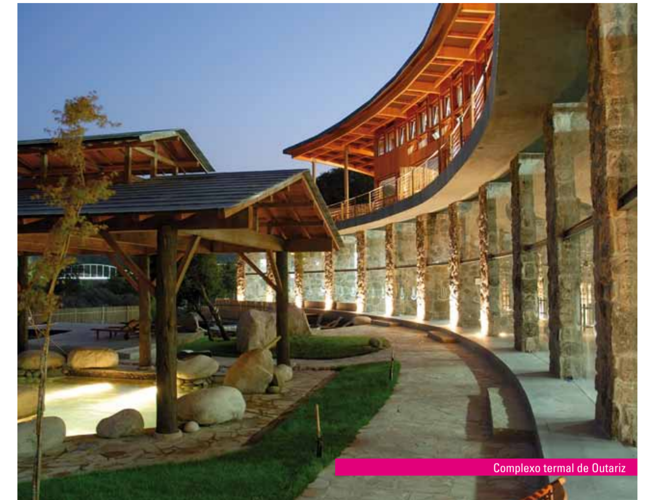
Complexo termal de Outariz

Seguindo a rota marcada, os nosos pasos levámonos até a fonte do Tinteiro; onde un sempre se sorprende polo gran número de persoas que acoden atraído polas súas supostas bondades curativas. Son, sen dúbida, as caldas de maior tradición da cidade, da que din os veciños que ten máis ourensanía . A partir de aquí aconsellamos