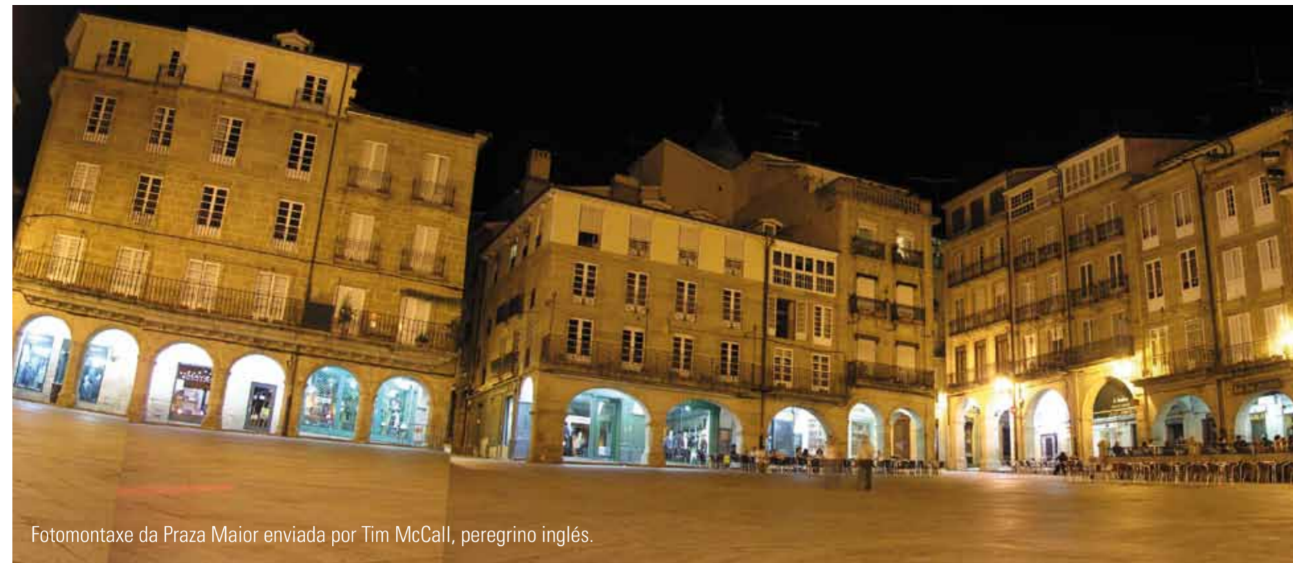
Fotomontaxe da Praza Maior enviada por Tim McCall, peregrino inglés.