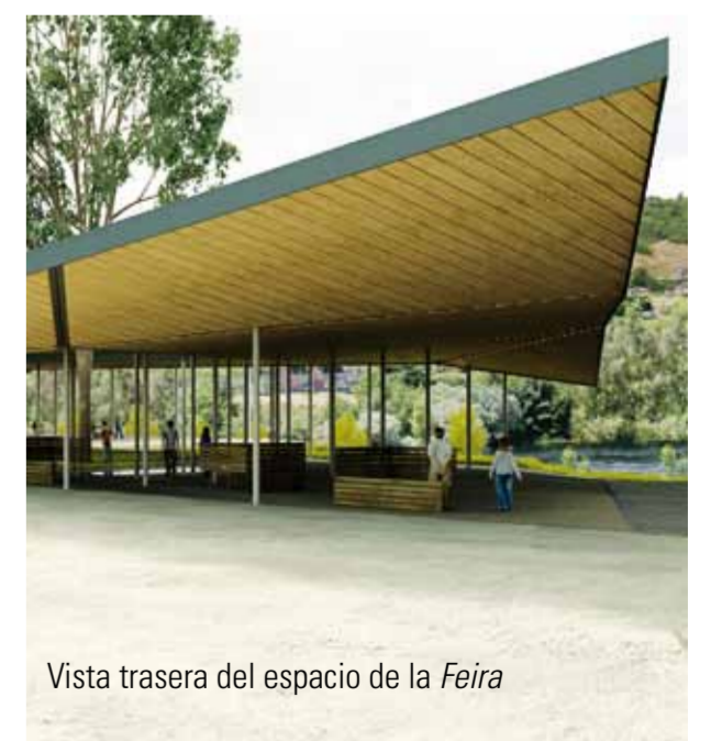
Vista trasera del espacio de la Feira

des culturales. Con esto se pretende recuperar la filosofía más características de estas ferias, la de ser un lugar de reunión. Además, el nuevo Campo da Feira quiere ser un referente de modernidad y de las capacidades termales de Ourense; un espacio entre aguas donde esta sea el elemento protagonista. En el proyecto, los arquitectos incorporaron un novedoso sistema de aprovechamiento geotérmico: el agua caliente, el agua termal a más de 50°C que mana por nuestros subsuelo será canalizado para alimentar un sistema de calefacción por suelo radiante. Es más, las aguas pluviales también serán aprovechadas, recogidas y reutilizadas para labores de limpieza. Materiales naturales, maderas y granitos en perfecto diálogo para reconstruir un espacio que ya es patrimonio de todos los ourensáns y que invitamos al turista a conocer. Para comer buen pulpo, los días 7 y 17, disfrutando de la belleza del Miño.