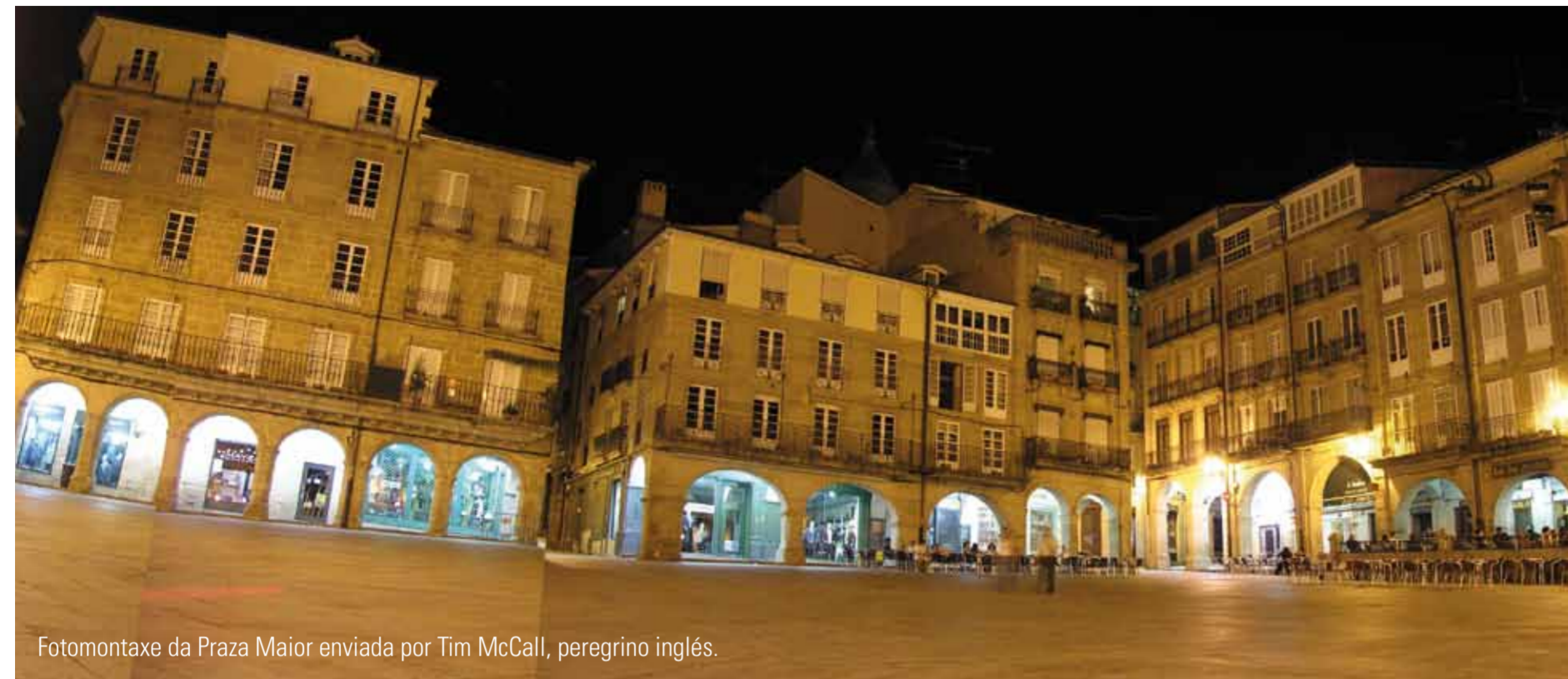
Fotomontaxe da Praca Maior enviada por Tim McCall, peregrino inglés.