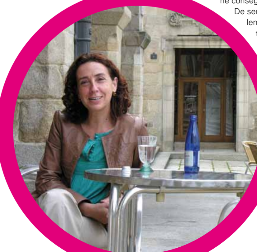
“A rúa do Paseo non perdeu seu nome nen nos anos duros do Franquismo. Sempre foi o Paseo”.

“Tomar algo en la Plaza Mayor es un auténtico lujo asiático y una de las cosas que nuestros visitantes comentan y valoran”.