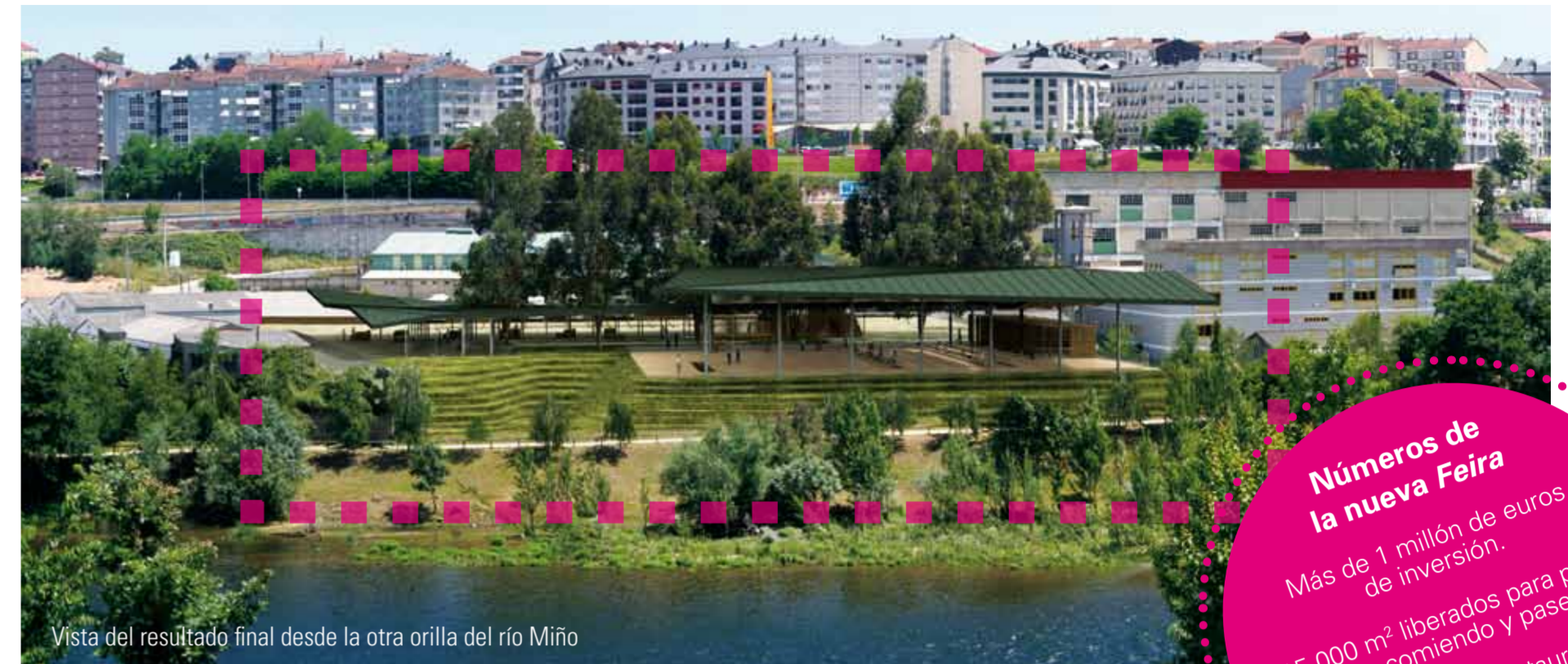
Vista del resultado final desde la otra orilla del río Miño

Números de la nueva Feira Más de 1 millón de euros de inversión. 15.000 m² liberados para poder disfrutar comiendo y paseando. Creación de un restaurante y servicio de bar permanente con 90 plazas.