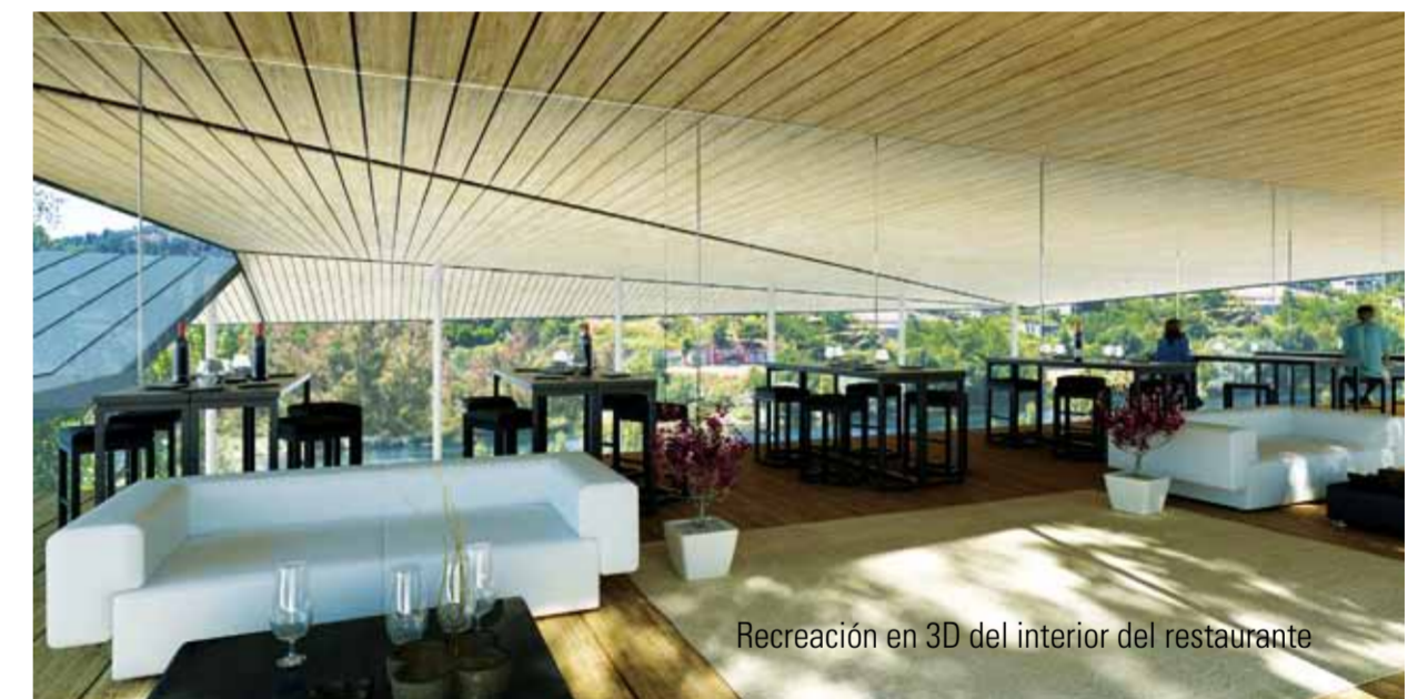
Recreación en 3D del interior del restaurante

des culturales. Con esto se pretende recuperar la filosofía más características de estas ferias, la de ser un lugar de reunión. Además, el nuevo Campo da Feira quiere ser un referente de modernidad y de las capacidades termales de Ourense; un espacio entre aguas donde esta sea el elemento protagonista. En el proyecto, los arquitectos incorporaron un novedoso sistema de aprovechamiento geotérmico: el agua caliente, el agua termal a más de 50°C que mana por nuestros subsuelo será canalizado para alimentar un sistema de calefacción por suelo radiante. Es más, las aguas pluviales también serán aprovechadas, recogidas y reutilizadas para labores de limpieza. Materiales naturales, maderas y granitos en perfecto diálogo para reconstruir un espacio que ya es patrimonio de todos los ourensáns y que invitamos al turista a conocer. Para comer buen pulpo, los días 7 y 17, disfrutando de la belleza del Miño.